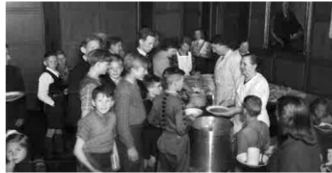
Utdelning av Svenskesuppe