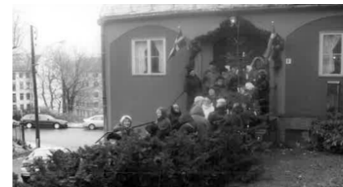
Kön in till julbasaren under 80-talet