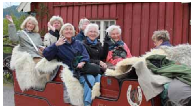
Utflykt med häst och kärra från Skjerven gård till Ullevålseter