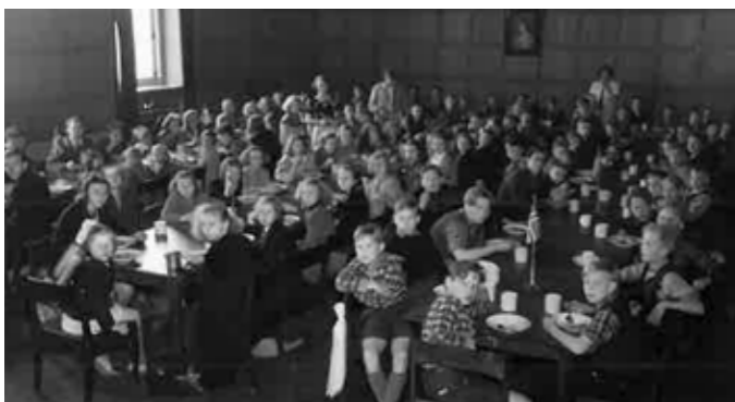
Stora salen under utdelning av Svenskesuppe

Numera fortsätter naturligtvis de traditionella mötena, där man träffas, utbyter tankar och minnen, reser på små utflykter, gärna med kulturellt innehåll. Vid jämna dagar uppvaktas med blommor.