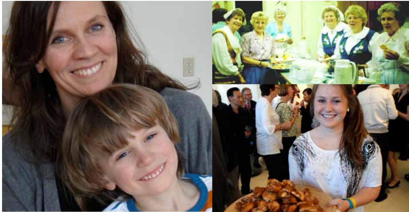
Frivillighet genom tiden i Toronto

Här om året firade Svenska kyrkan i Toronto 60-årsjubileum. Att den svenska församlingen i Kanadas största stad uppnått denna aktningvärda ålder, beror mycket på frivilliga instanser från den aktiva kärnan av församlingens medlemmar. Utan deras personliga engagemang och generösa bidrag med sina färdigheter och kunskaper, sin tid och entusiasm, är det tveksamt ifall verksamheten hade överlevt rent praktiskt och ekonomiskt. Att så många som möjligt utan ersättning bjuder på det var och en kan ställa upp med, har blivit en förutsättning för att församlingsarbetet ska fungera.